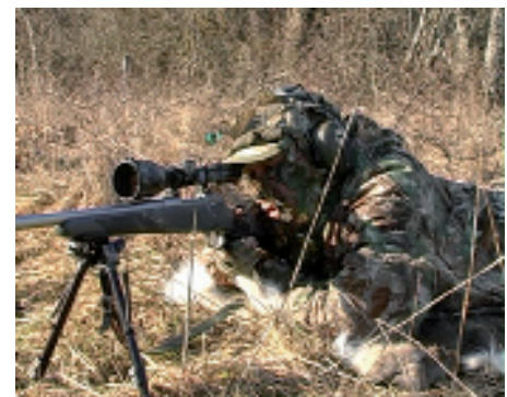
P-A. Åhlén vábí a loví lišky během dne. Ví, že neodolají